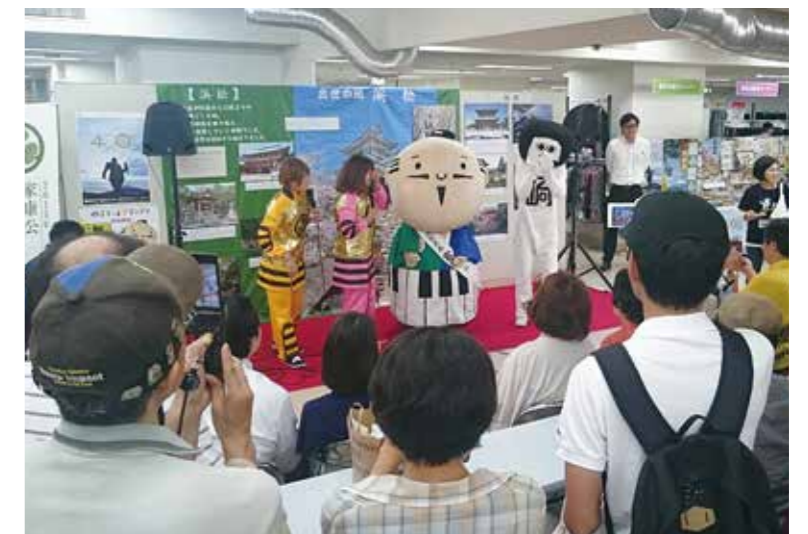
地元特産品を紹介する出世大名家康くんとおかざえもん、おかざきPR隊

また、はままつ副市長・出世大名家康くんやオカザえもん、おかざきPR隊「メロある」、グレート家康公「葵」武将隊によるステージイベントのほか、静岡茶の無料試飲などでもてなした。期間中、各市の日を1日ずつ設け、お買い上げの方に粗品をプレゼントした。