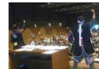
試験開始前に勝鬨で気合を入れる「葵」武将隊