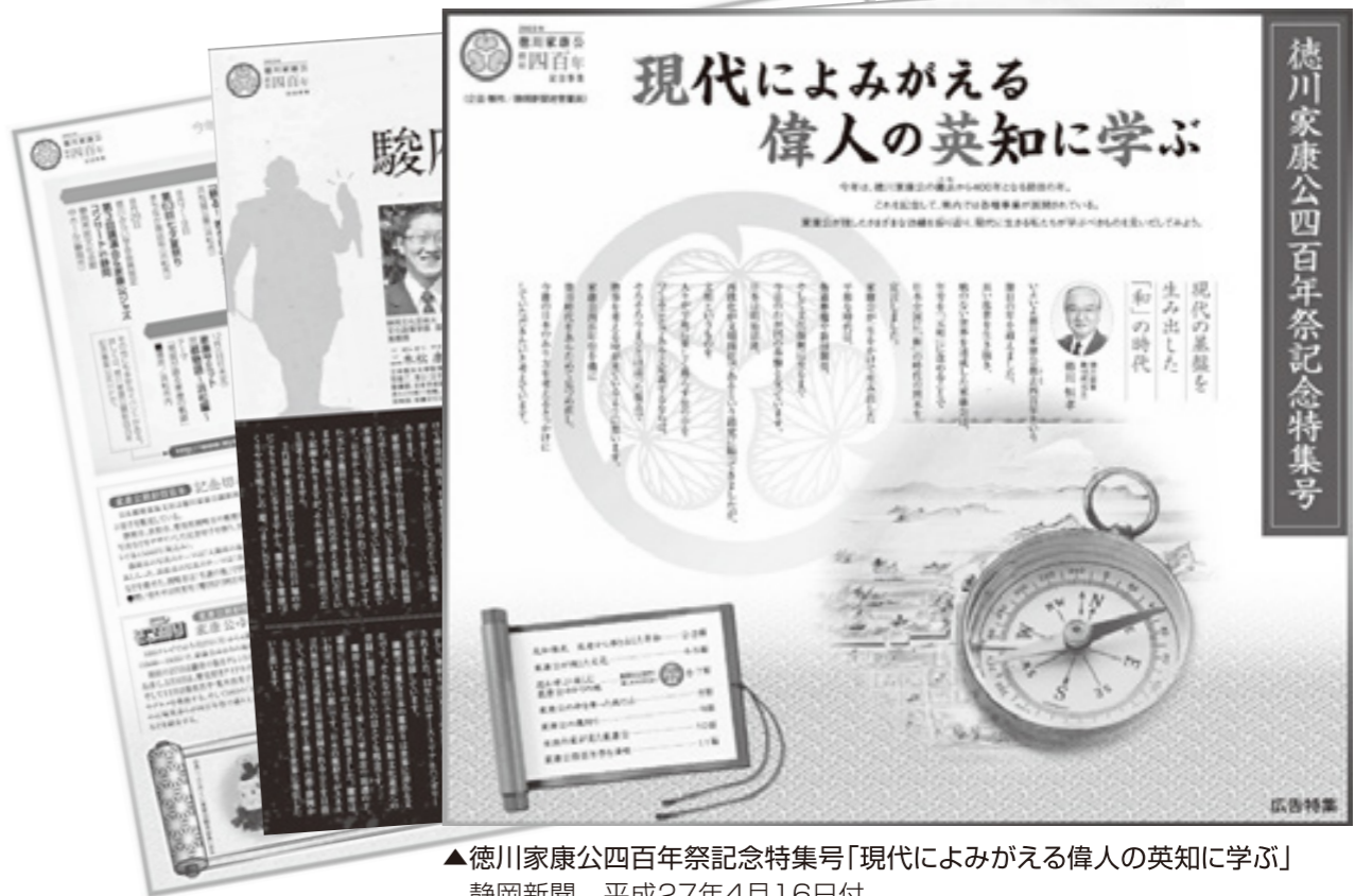
▲徳川家康公四百年祭記念特集号「現代によみがえる偉人の英知に学ぶ」静岡新聞 平成27年4月16日付