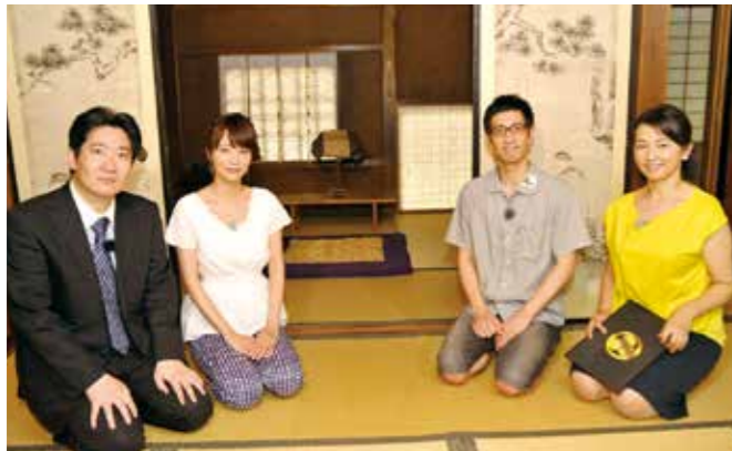
▲SBSテレビ「磯田道史の目からウロコの新事実! 郷土のHERO家康」(全6回)