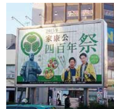
【岡崎市】東岡崎駅前大型広告