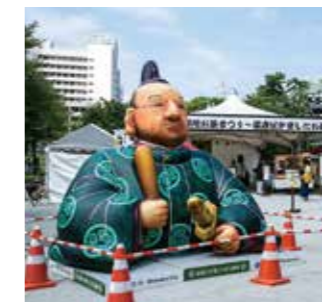
【静岡市】リアルバルーン

四百年祭の「シンボル」となる大型オブジェ「大御所バルーン」、「一富士二鷹三茄子バルーン」。