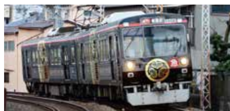
【静岡市】家康公四百年祭ラッピングトレイン

静岡市内を結ぶ静岡鉄道の車両に大きな葵の御紋をあしらひ、家康公四百年祭と「家康公が愛したまち静岡」を大々的にPRしたラッピングトレイン。