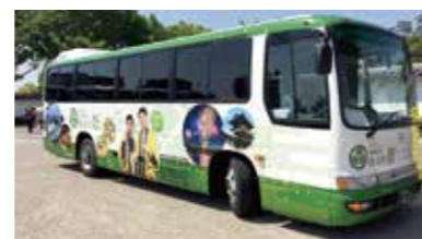
【岡崎市】観光ラッピングバス

家康公ゆかりのスポットが回遊できる「岡崎歴史かたり人と行く 家康公ゆかりの地 早めぐりツアー」のラッピングバス。