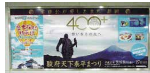
【静岡市】しず地下広告ボード

各種イベント情報を中心に、プロモーションアート作品や家康公像を用いるなど、インパクトのある広告をJR静岡岡駅北口地下広場の広告ボード全面に掲出した。