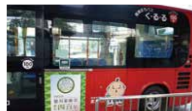
【浜松市】ラッピングバス

静岡市内を結ぶ静岡鉄道の車両に大きな葵の御紋をあしらひ、家康公四百年祭と「家康公が愛したまち静岡」を大々的にPRしたラッピングトレイン。