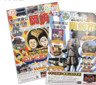
【岡崎市】イベントチラシ

12月24日に浜松市福祉交流センターで開催した「浜松部会グランドフィナーレ」のチラシ及びポスター。