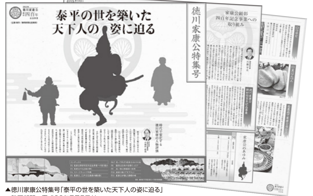
▲徳川家康公特集号「泰平の世を築いた天下人の姿に迫る」静岡新聞 平成26年7月5日付